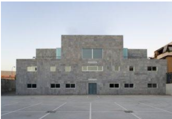
Fig. 3: Parking

Características de las instalaciones: El edificio está climatizado (frío y calor) con regulación independiente en cada espacio, cuenta con acceso para minusválidos y ascensor, así como zona de descanso y aseos. Tiene acceso al parking exterior privado.