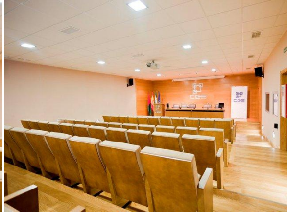
Fig. 6: Salón de actos

Sala de juntas: Capacidad para 27-34 personas. Dispone de dos televisores para la proyección de presentaciones. Espacio privado para reuniones.