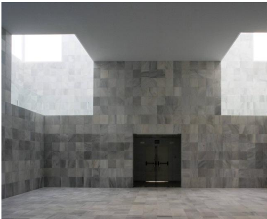
Fig. 15: Hall planta baja

Hall planta baja: Capacidad de hasta 200 personas. Espacio destinado para recepción, desayuno y/o cóctel. Zona de exposición.