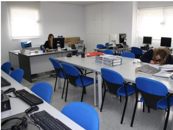
Fig. 11: Aula de informática

Aula de informática: Capacidad para 20 personas. Dispone de 20 ordenadores individuales, internet-wifi.