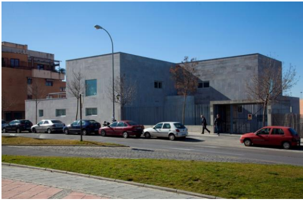
Fig. 1: Vista exterior del edificio

La Confederación Granadina de Empresarios se ubica en la C/ Maestro Montero, número 23, de Granada. Está situada frente al Hotel Nazaríes, cerca de la principal calle de la ciudad y muy bien conectada a la circunvalación y al transporte urbano.