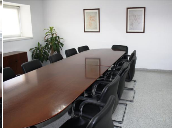
Fig. 14: Sala de reuniones

Hall planta baja: Capacidad de hasta 200 personas. Espacio destinado para recepción, desayuno y/o cóctel. Zona de exposición.