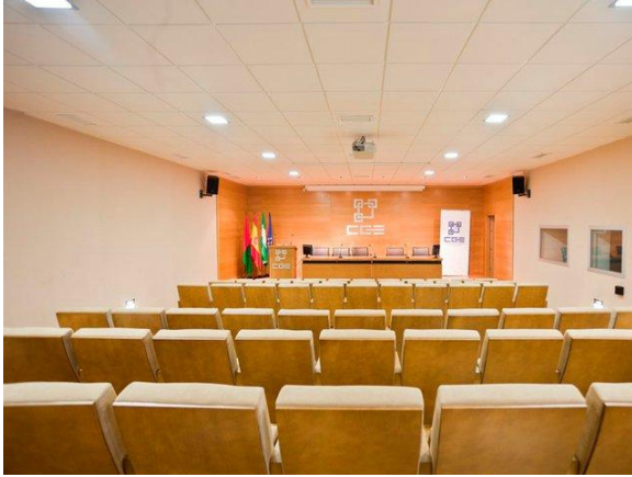
Fig. 5: Salón de actos

Salón de actos: Capacidad para 120 personas. Dispone de atril, mesa presidencial con 5 puestos, cabina de sonido, cañón-proyector, internet-wifi.