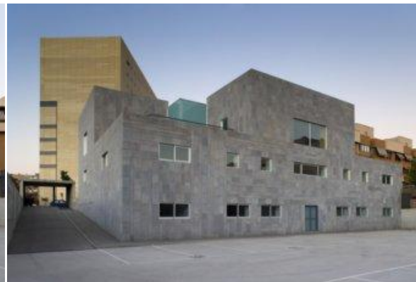
Fig. 4: Parking