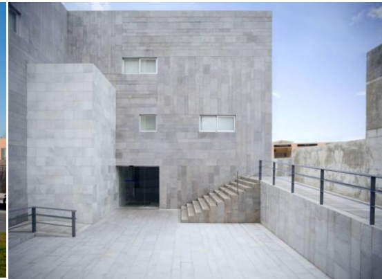
Fig. 2: Entrada principal