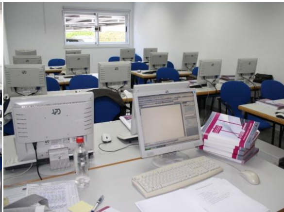
Fig. 12: Aula de informática