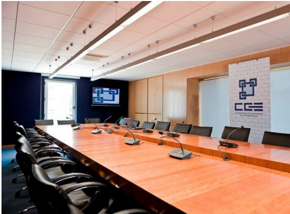
Fig. 7: Sala de juntas

Sala de juntas: Capacidad para 27-34 personas. Dispone de dos televisores para la proyección de presentaciones. Espacio privado para reuniones.