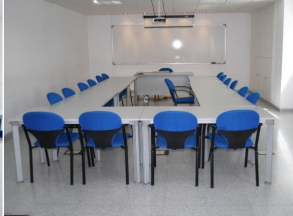
Fig. 10: Sala de formación

Aula de informática: Capacidad para 20 personas. Dispone de 20 ordenadores individuales, internet-wifi.