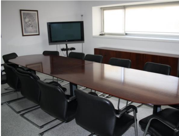
Fig. 13: Sala de reuniones

Sala de reuniones: Capacidad para 12-15 personas. Dispone de televisión para proyección y papelógrafo. Internet-wifi.