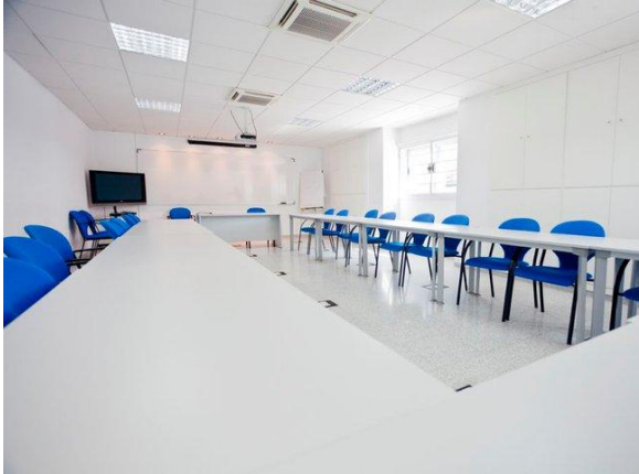
Fig. 9: Sala de formación

Aula - sala de formación usos múltiples: Capacidad para 40 personas, dispone de cañón proyector, pizarra, internet-wifi.